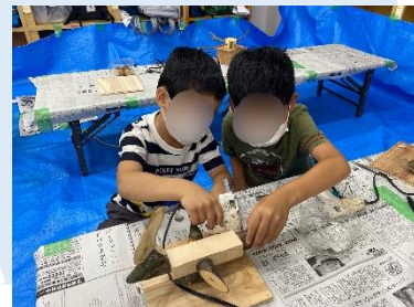
工作教室。1年生に優しく教えて くれてありがとう。