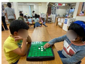
ゲーム大会。 みんな真剣勝負です！